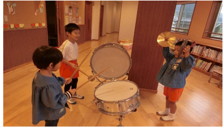
いろんな楽器に触れ、音を聴き比べたり、メロディ楽器を弾いてみたり、曲に合わせてリズム打ちをしたり…。友だちと一緒に夢中で楽しんでいる様子がうかがえます。年下の子にも教えてあげていましたよ！