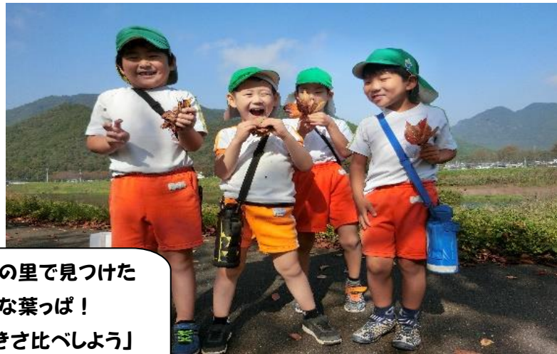
年輪の里で見つけた大きな葉っぱ！「大きさを比べよう」