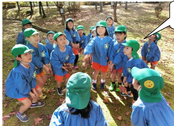
落ち葉を集めて「せ〜のっ！」

11月から登校練習が始まったさくら組。「歩いてしんどくなかった？」と尋ねると、みんな口をそろえて「ぜんぜんしんどくなかった！」と…。「なんでわかる？」と返すと「散歩でいっぱい歩いてるもん！」「外で元気に遊んでるもん！」と自信たっぷりに答えてくれました。本当にその通りです！！ さくら組は外遊びが大好きで、午後も『どろけい(泥棒と警察)』で走り回ったり、『まるじゃう』や『サッカー』をしたり元気いっぱい！！ 散歩では、朝阪や里山ごんげんさんに歩いて行き、道中いろんな自然物や建物、標識などに触れました。【気づいたこと】【発見したこと】【不思議に思ったこと】【わからない事】を友だちと共有し合ったりもしました。 楽しい経験・友だちと目的に向かって頑張る経験を積み重ね、充実した日々を大切に過ごしていきたいです。