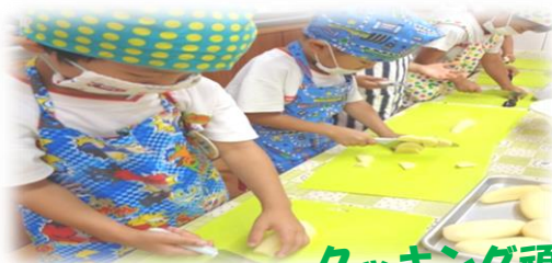
クッキング頑張ったよ!

「水に親しむ」というねらいのもと、0歳児から年齢に応じた様々な遊びを経験していきます。友達の姿に刺激を受けたり、励ましてもらったりしていくうちに、少しずつ出来ることが増えてきました。5歳児になる頃には、泳げるようになってきます。